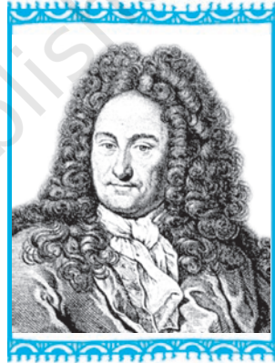
G .W. Leibnitz (1646–1716)